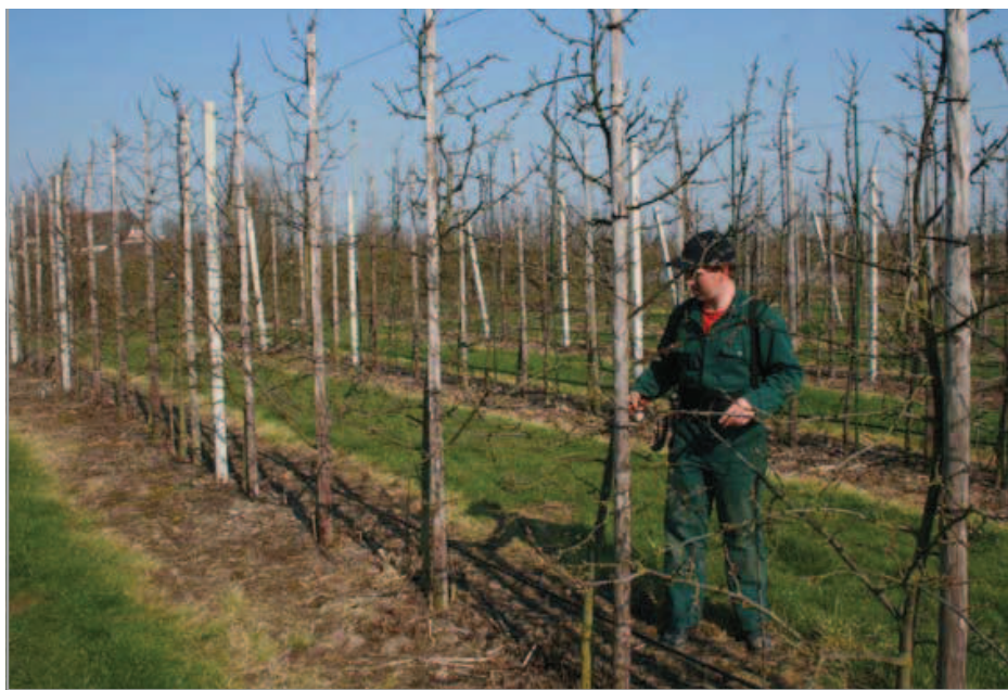
De bomen op VVA-1 blijven klein, waardoor het meeste werk vanaf de grond gedaan kan worden.

Bij de matig productieve rassen is het verschil in productie-efficiëntie groot. Bij Avalon is het aantal geogste vruchten per vierkante centimeter stamdoorsnedeoppervlak bij de bomen op VVA-1 3,4 keer zo hoog (0,41) als bij de bomen op St. Julien A (0,12). Bij Excalibur is het verschil nog groter, namelijk 4,3 keer (0,26 vruchten/cm 2 bij bomen op VVA-1 tegen 0,06 bij bomen op St. Julien A).