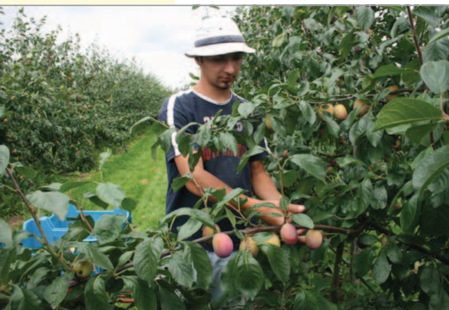
VVA-1 geeft kleine, hoogproductieve bomen.

Reine Victoria staat bekend als een productief ras. Ook op een sterke onderstam kunnen bomen al