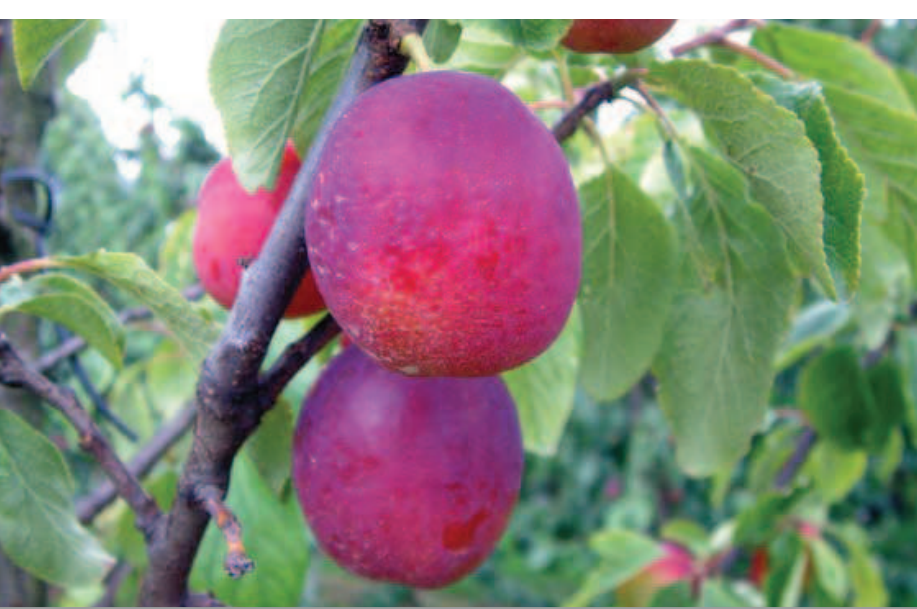
Bij matig productieve rassen is de invloed van VVA-1 op de productie het grootst.